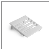
Záslepka NIBO šedá Ref: 24001