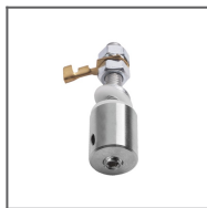
Závěska P-BOX-Z Ref: 42554