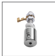
Závěska W-BOX-Z Ref: 00643