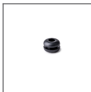
Gumová průchodka 6x1,2 Ref: 00802