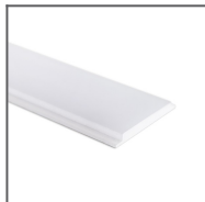
Podložka pod trafo 45 Ref: 70011