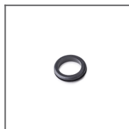
Gumová průchodka 19x1,6 Ref: 00820