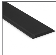
Podložka pod trafo 45 Ref: 70457