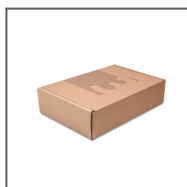
Prezentační box 3 Ref: 90053