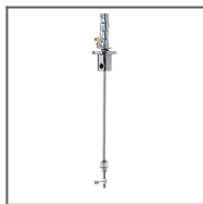
Sestava uchycení M15 Ref: 42614